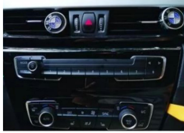
2. Zentralbedienfeld des Originalfahrzeugs aushebeln.