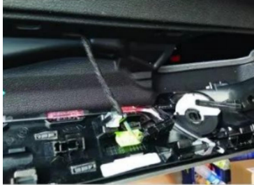
6. Stecker der Luftauslassblende des Originalfahrzeugs abziehen.