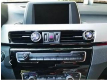
1. Schema der Mittelkonsole des Originalfahrzeugs.