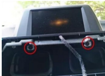
8. Befestigungsschrauben des Originalbildschirms entfernen.