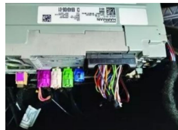
11. Stecker der originalen Haupteinheit abziehen.