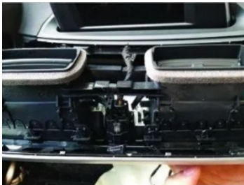
7. Stecker der Luftauslassblende des Originalfahrzeugs abziehen.