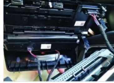
3. Stecker des Bedienfelds abziehen