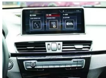
15. Ergebnisbild nach der Installation.