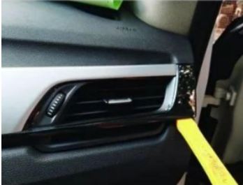
4. Luftauslassblende des Originalfahrzeugs aushebeln.