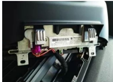
9. Stecker des Originalbildschirms abziehen.