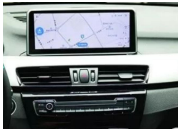
14. Ergebnisbild nach der Installation.