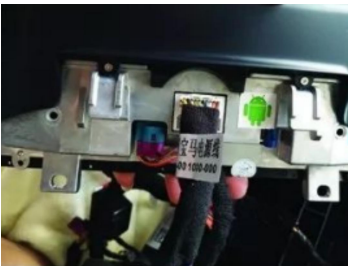
13. Unseren Bildschirm anschließen.