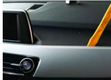
5. Luftauslassblende des Originalfahrzeugs aushebeln.