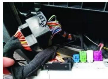
12. Verbindung zwischen Stecker und originale Haupteinheit-Stecker.